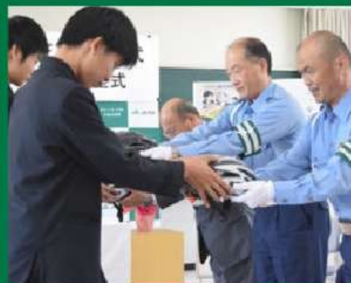
県内初のヘルメットモデル校！