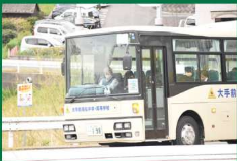
専用のスクールバス