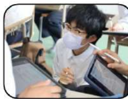
〈相談しながら問題解決！〉