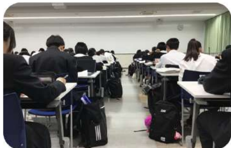
《in プールホール》NSSで勉強する高校生

Night Study Support (NSS) は放課後に希望制で自習できる制度。 誘惑は一切無く勉強に集中できる環境。 また、職員室に質問しに行くこともできる。