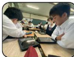
〈授業で協力しながら資料作成！〉

定額制の映像授業配信サービス。プロ講師のクオリティの高い授業が見放題！自主勉強の強い味方です。先取り学習や復習、志望校対策など幅広く役立てられ、内容が充実しています。