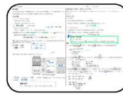
〈iPadを使った物理の授業解説〉 動画共有やプリント配布など使いどころがさまざま