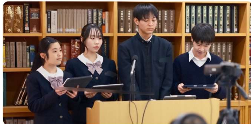
探究学習でプレゼンを行う生徒 (P1グランプリ→P6へ)