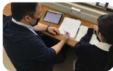
《in 職員室》大学受験に向けて、先生に勉強の質問をしている3年生